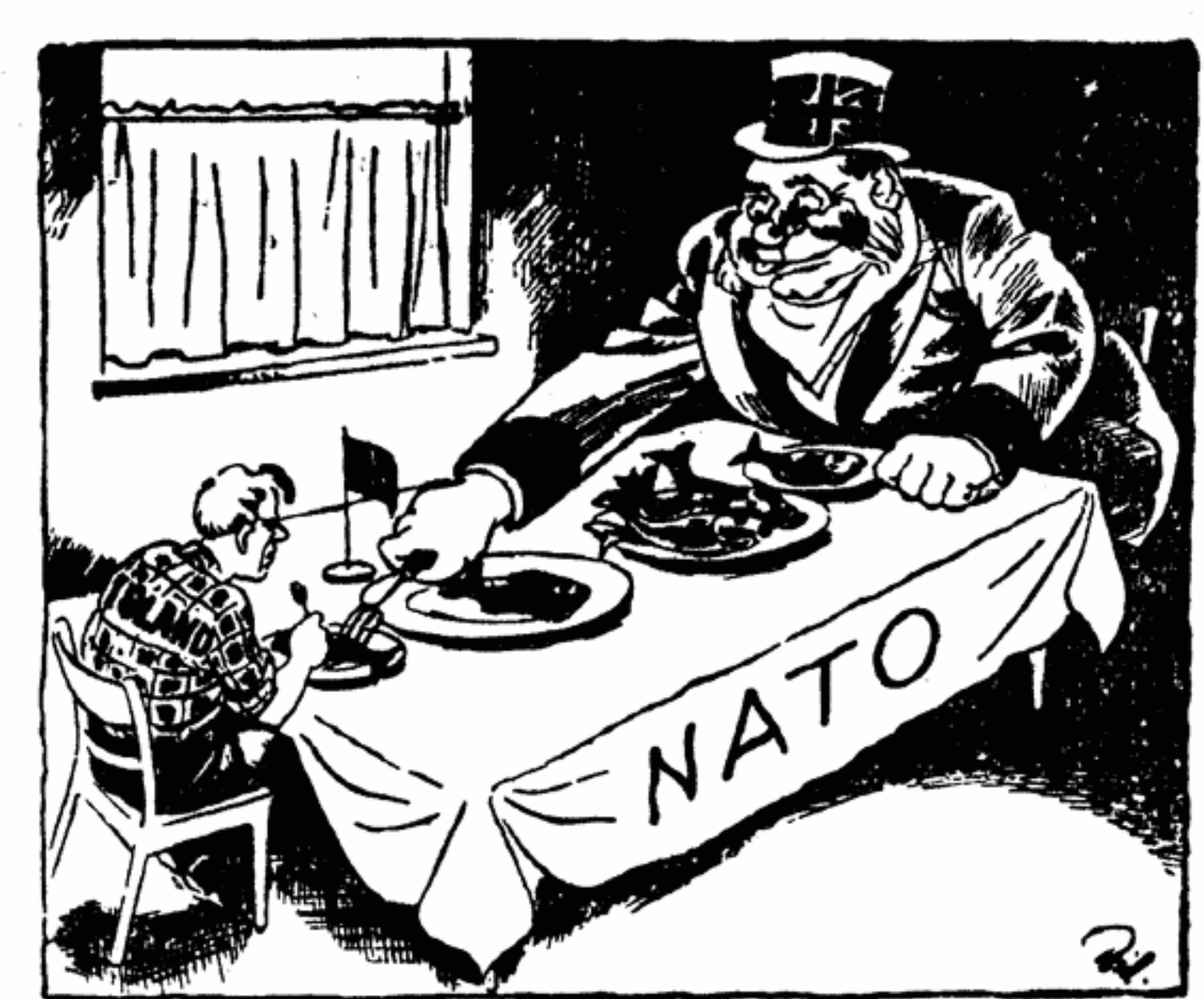
Английские траулеры под охраной военных кораблей ведут пиратский лов рыбы в территориальных водах Исландии. Вот что придется терпеть, раз уж имеешь дело с атлантическими джентльменами...

НЕ ТРЕБУЕТСЯ ЛИ МАНИКЮР... ЗА СТОЛОМ НАТО