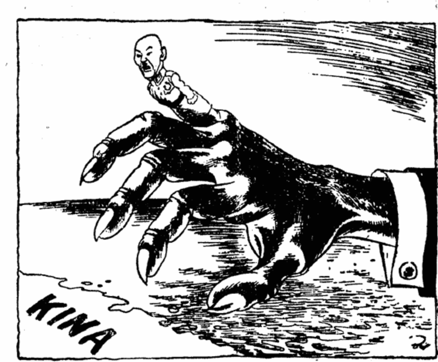
Даял Сам опять протягивает руку к китайскому матерку в районе Тайваньского пролива, но это лишь для того, чтобы ему поддечили мизанец и острелили ногти...

Весьма злободневно звучат сейчас слова великого французского писателя и патриота Виктора Гюго, говорившего в 1848 году: «Конституция, и в особенности новая конституция, созданная Францией и для Франции, обязательно должна быть новым шагом по пути цивилизации. Если она не является шагом по пути цивилизации, она — ничто».